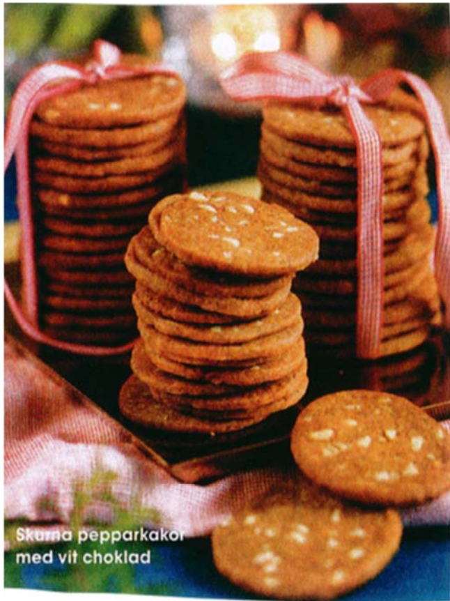
Skurna pepparkakor med vit choklad